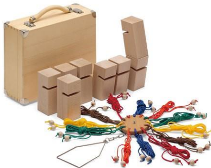
Tower of Power